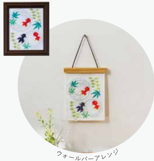
ウォールバーアレンジ