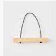
13cm / ナチュラルカラー

木製ウォールバー 13cm / ナチュラルがぴったり。風に揺れて、より涼しげなイメージに仕上がります。