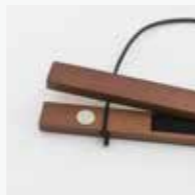
しっかりはさめるネオジム磁石