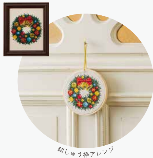
刺しゅう枠アレンジ