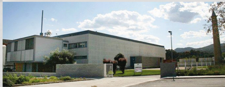
Фабрика LAKIDAIN, Испания, Барселона