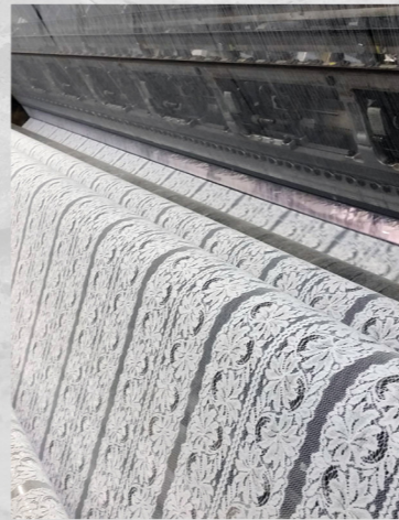
Производство кружева на фабрике LAKIDAIN

Разнообразный дизайн. Качество. Конкурентная цена. Вот цели компании LAKIDAIN.