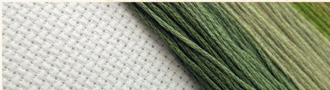
Наборы для вышивания на аиде (14 ct, 18 ct)