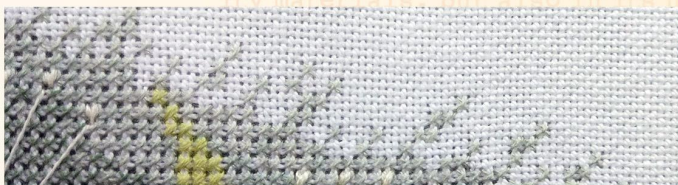
Наборы для вышивания на равномерке (27 ct)