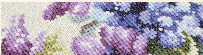
Наборы для вышивания на льне (27 ct, 30 ct, 35 ct)