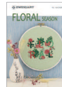
104/328 Floral Season Chart-Heft / PG VI Kreuzstich (cross stitch · point de croix) 24 Seiten · pages · pages