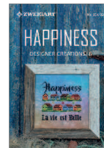
104/326 Happiness Chart-Heft / PG VII Kreuzstich (cross stitch · point de croix) 28 Seiten · pages · pages