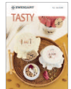
104/329 Tasty Chart-Heft / PG V Kreuzstich (cross stitch · point de croix) 20 Seiten · pages · pages