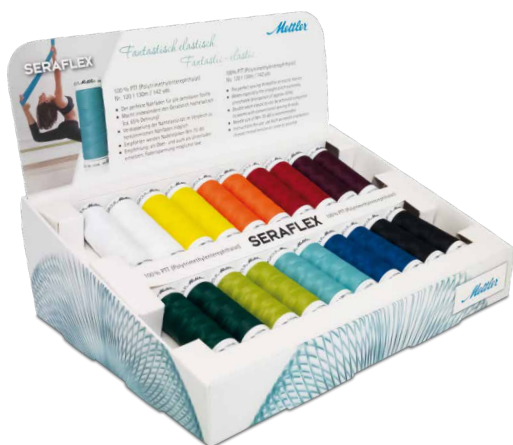
Дисплей DIS7840-KIT с выбором самых ходовых цветов