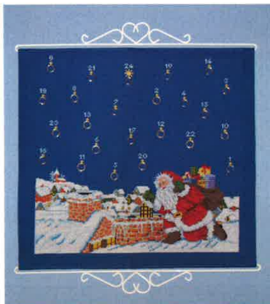
70204 (F) ca. 51 x 55 cm