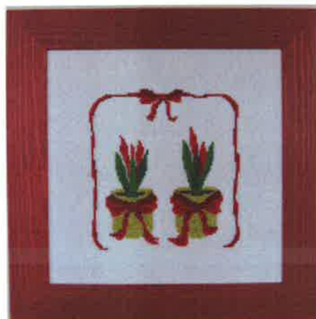
70212 (M) 70213 (H) ca. 23 x 23 cm