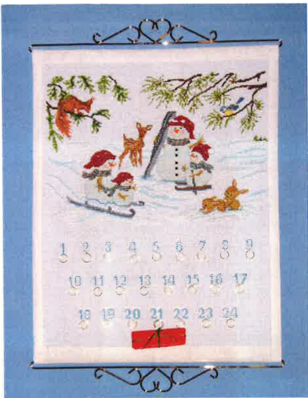
70207 (F) ca. 50 x 63 cm