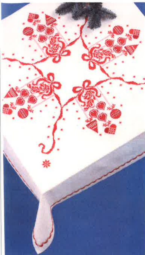
51507 (P) 51508 (F) ca. 130 x 130 cm