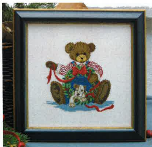
30209 (H) ca. 27 x 27 cm