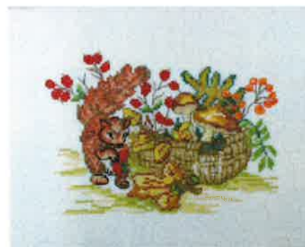
42008 (N) 42009 (D) ca. 24 x 30 cm