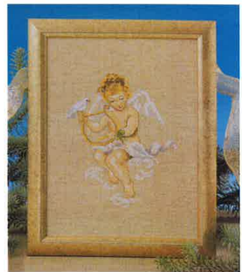
99326 (D) ca. 20 x 26 cm