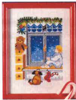
58201 (H) ca. 11 x 15 cm