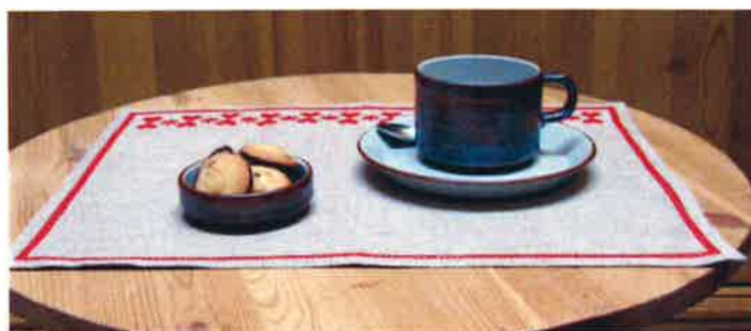
40312 (M) ca. 32 x 40 cm x 2