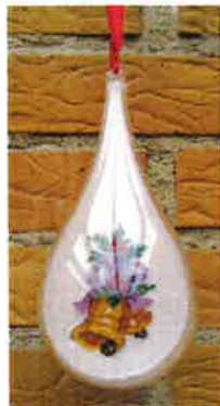
50215 (H) ca. 8 x 18 cm