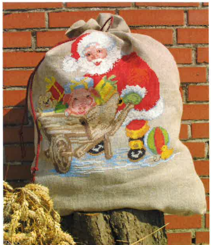
42015 (P) ca. 60 x 85 cm