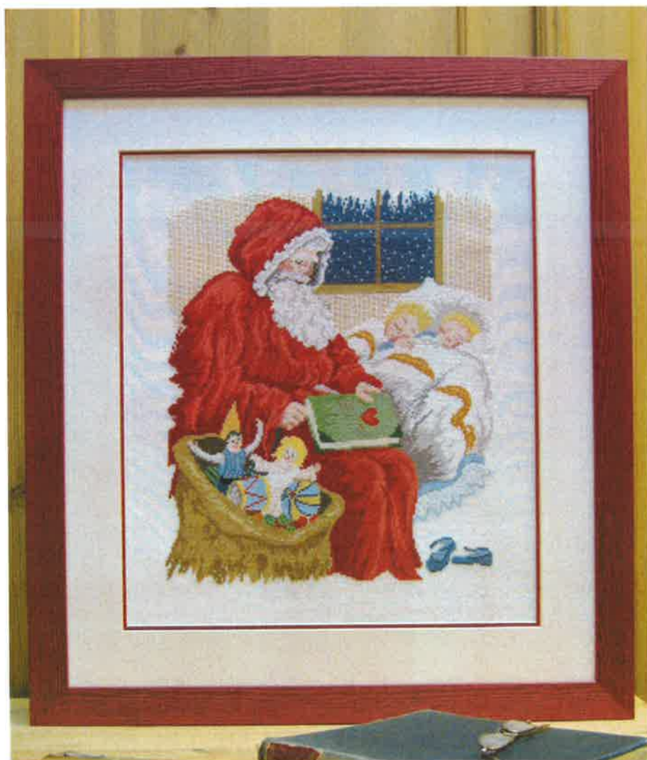
40309 (N) 40310 (F) ca. 53 x 59 cm