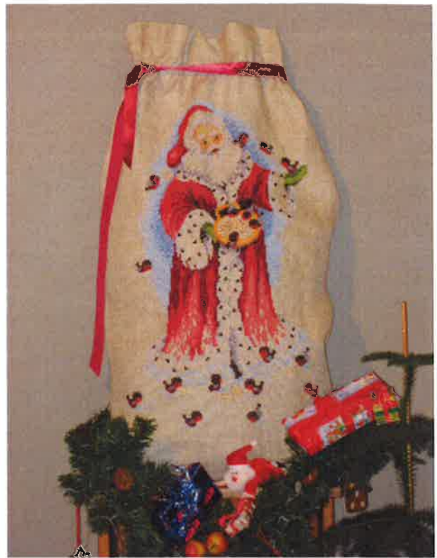
91221 (T) ca. 47 x 84 cm