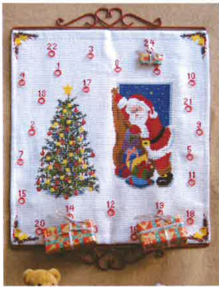
30215 (F) ca. 49 x 52 cm