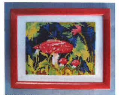
60220 (D) ca. 13 x 17 cm