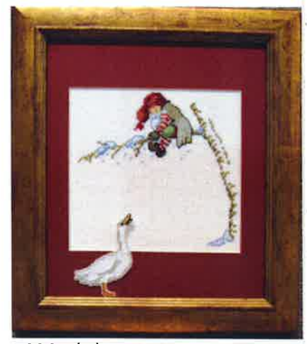
40301 (D) ca. 215 x 25 cm