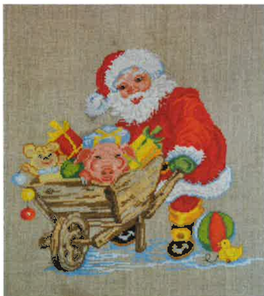
51514 (N) ca. 50 x 60 cm