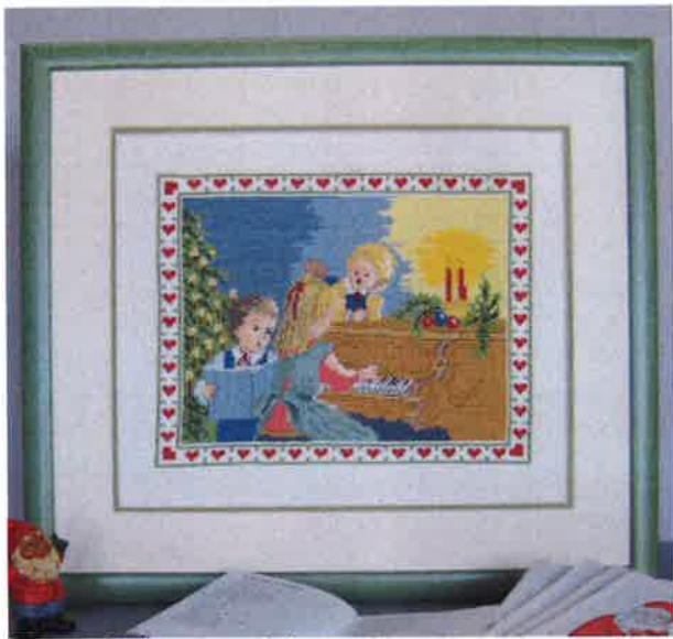
60200 (N) 60201 (D) ca. 38 x 44 cm