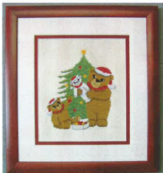
13102 (N) 13103 (D) ca. 34 x 38 cm