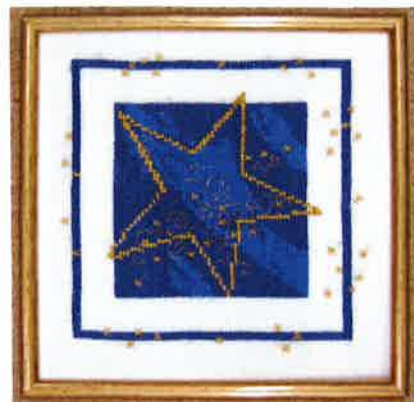
91204 (N) 91205 (D) ca. 18 x 18 cm