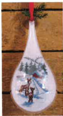
40306 (H) ca. 8 x 18 cm