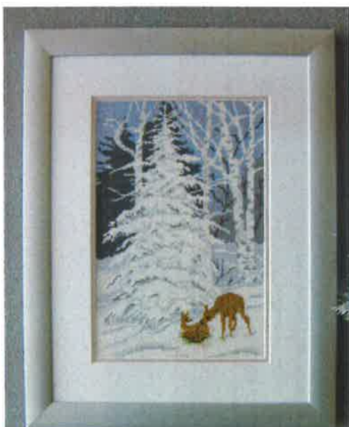
13106 (N) 13107 (D) ca. 30 x 40 cm