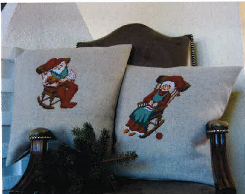
38-13 (AB) 38-14 (AB) ca. 50 x 50 cm