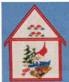
91220 (H) ca. 11 x 16 cm