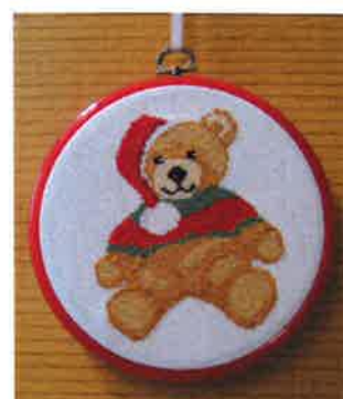
60211 (H) ca. 15Ø cm