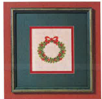
99328 (M) 99329 (H) ca. 30 x 31 cm