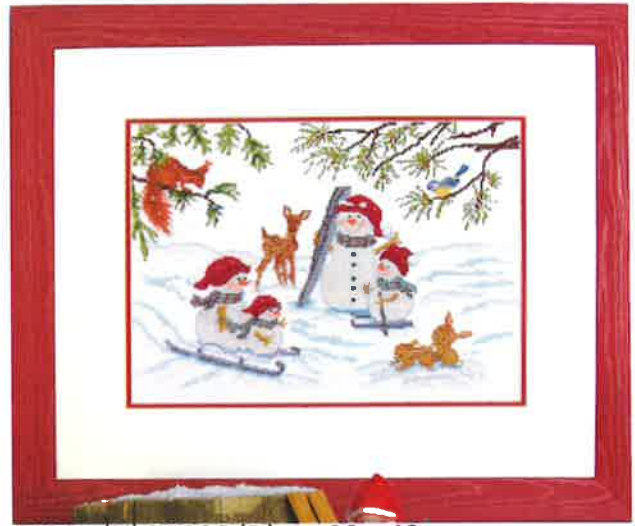
70205 (N) 70206 (D) ca. 39 x 49 cm