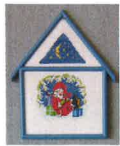
91206 (H) ca. 11 x 16 cm