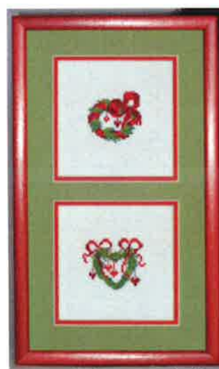
70215 (M) 70216 (M) ca. 11 x 11 cm