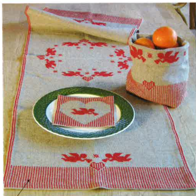
42011 (P) ca. 55 x 150 cm 42013 (P) 25 x 30 cm 42014 (P) ca. 16 x 16 cm x 2