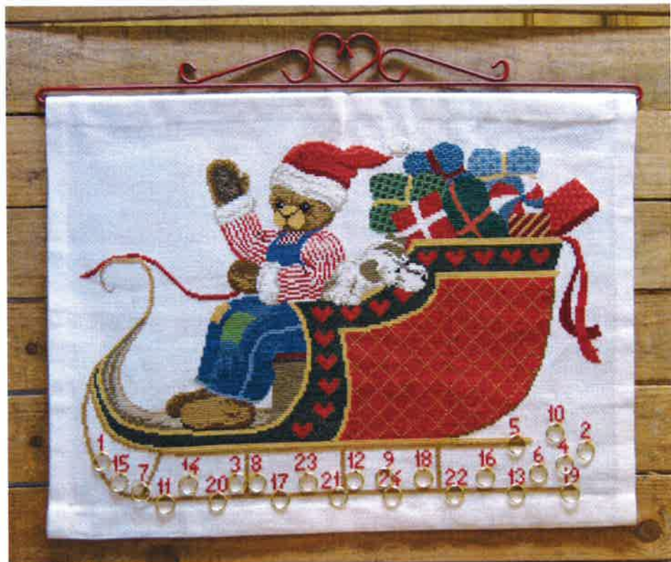
40302 (F) ca. 40 x 55 cm