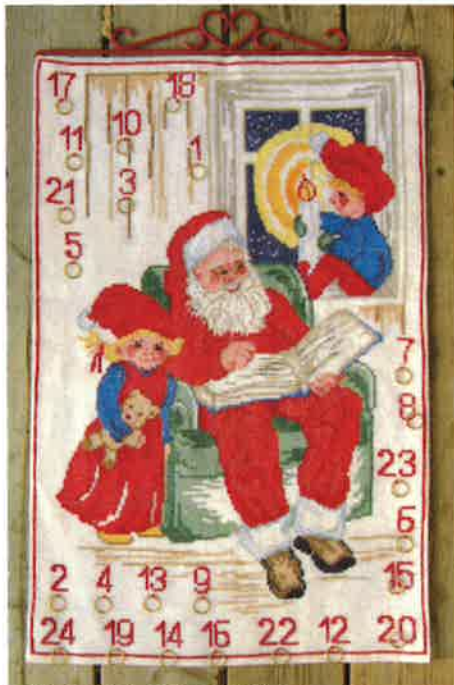
42000 (D) 42001 (P)