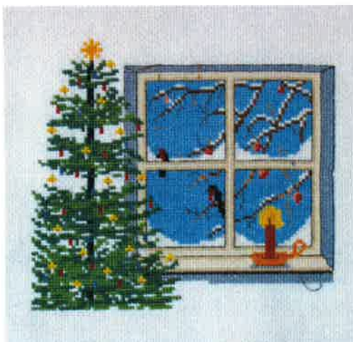
51518 (N) 51519 (D) ca. 24 x 24 cm