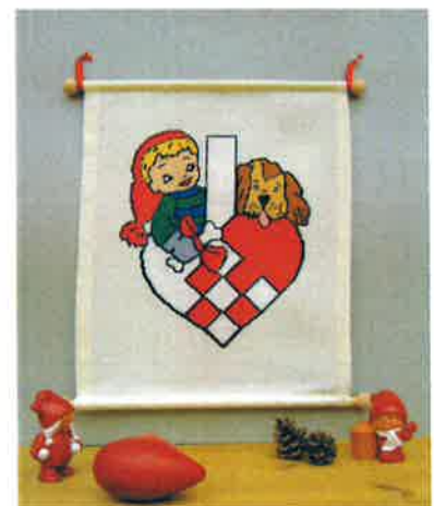
50204 (F) ca. 41 x 53 cm