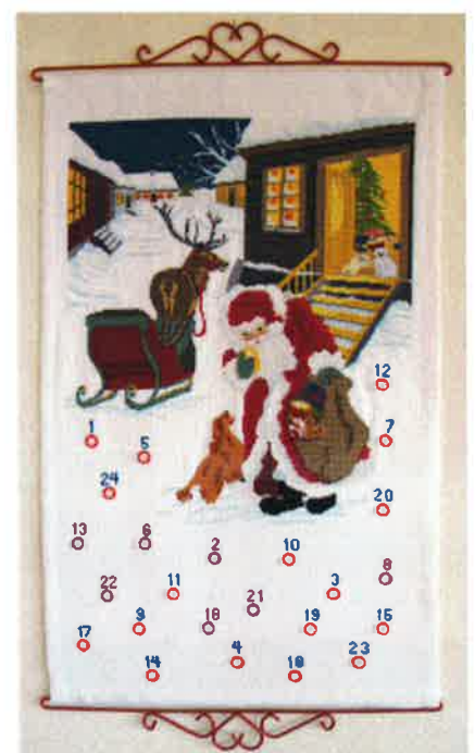
26000 (F) ca. 48 x 78 cm