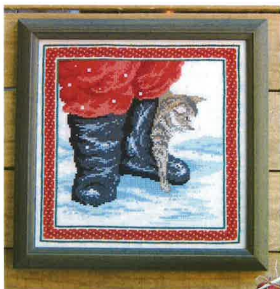
30205 (M) ca. 22 x 22 cm