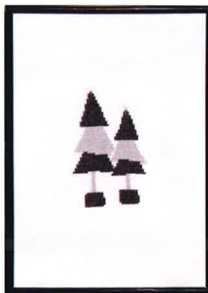
51509 (N) 51510 (D) ca. 20 x 29 cm