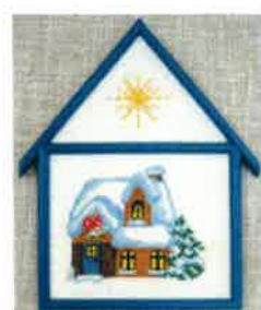
60205 (H) ca. 11 x 16 cm