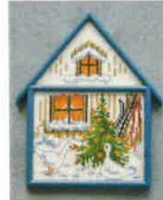
30203 (H) ca. 11 x 16 cm