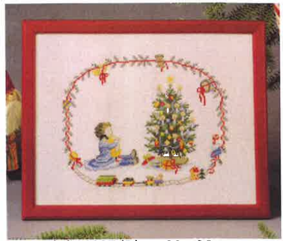
99336 (N) 99337 (D) ca. 28 x 36 cm