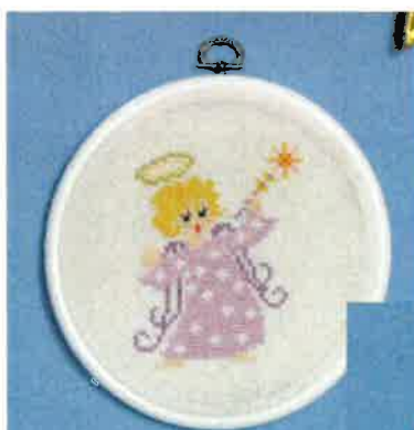
70201(N) ca. 16Ø cm