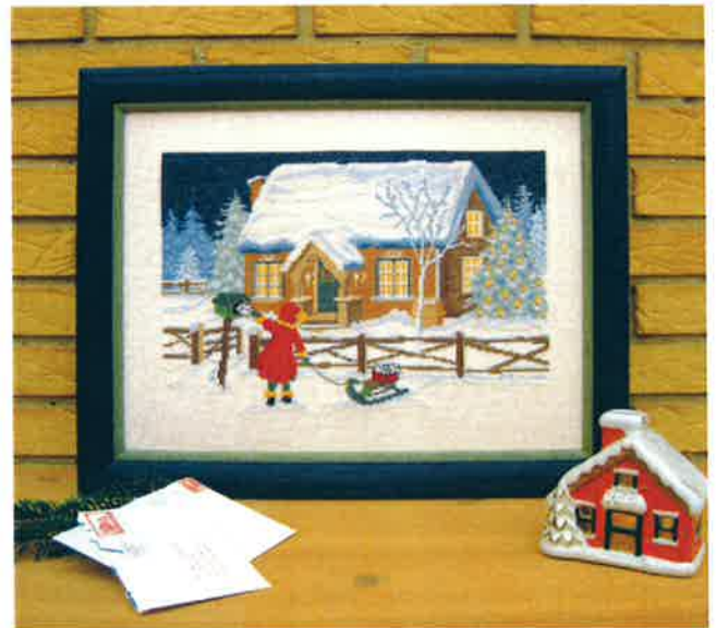
50219 (N) 50220 (D) ca. 34 x 46 cm