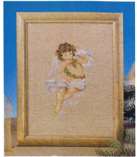
99325 (D) ca. 20 x 26 cm