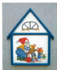
50201 (H) ca. 11 x 16 cm