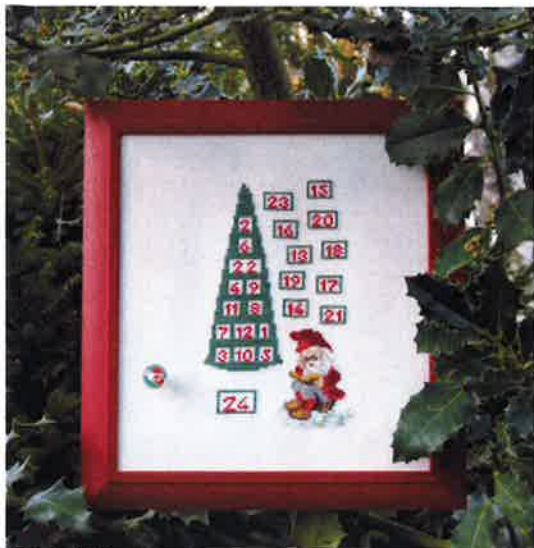
38-3 (N) ca. 28 x 30 cm