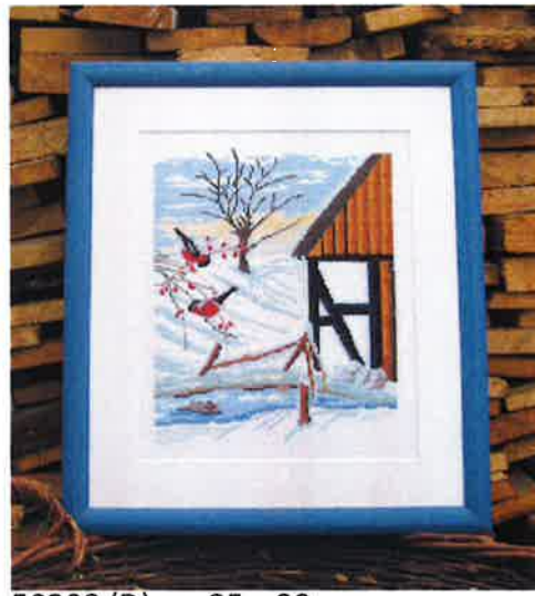
50208 (D) ca. 35 x 39 cm