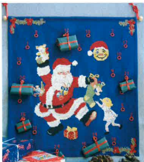
30202 (F) ca. 34 x 60 cm