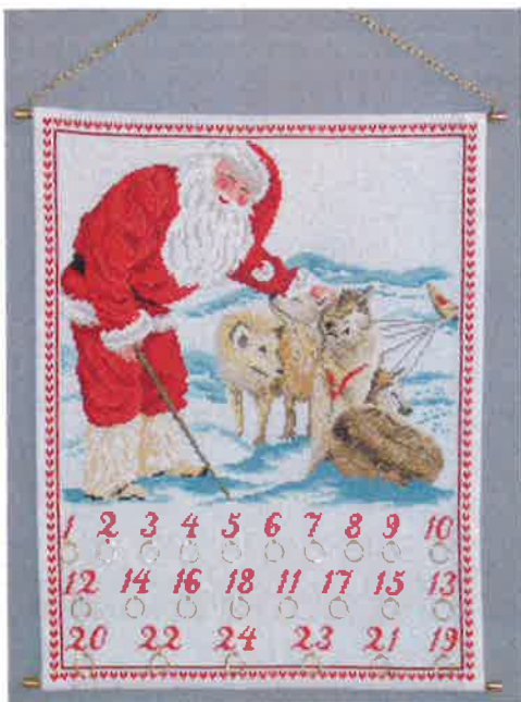
40300 (F) ca. 40 x 48 cm