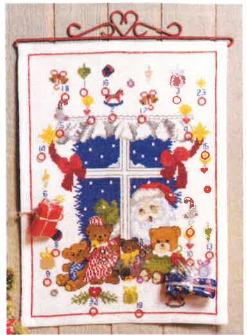
11200 (F) ca. 30 x 43 cm