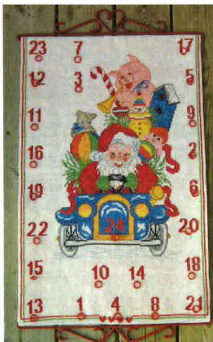
42002 (P) ca. 43 x 67 cm