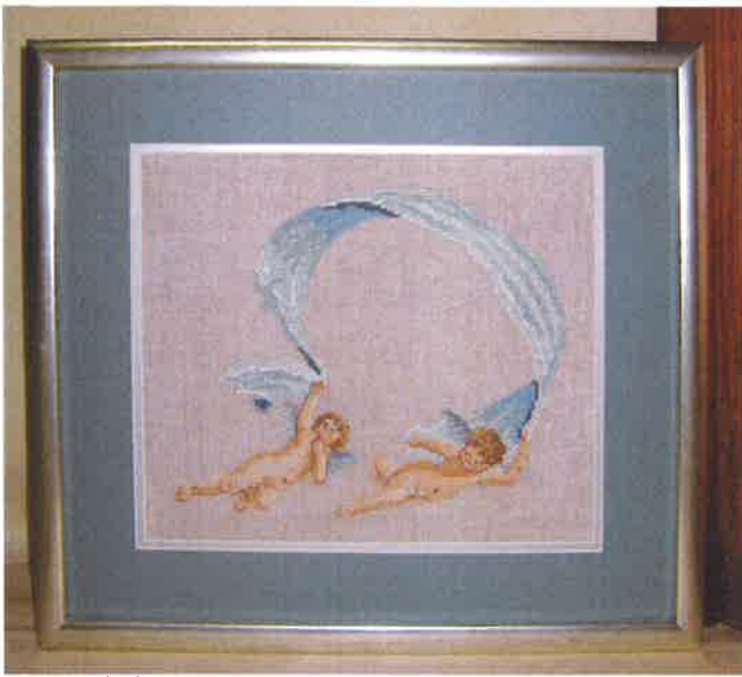
60215 (N) ca. 35 x 39 cm