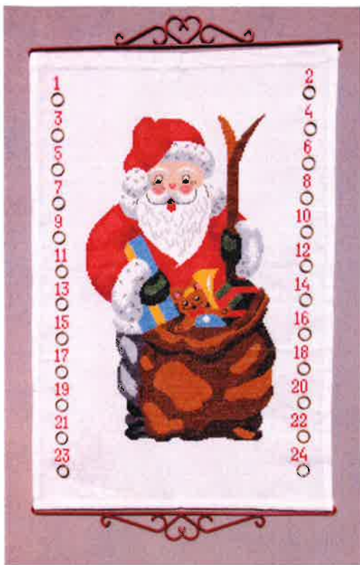
51514 (A) ca. 55 x 75 cm