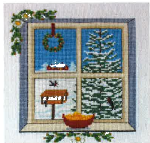
51520 (N) 51521 (D) ca. 24 x 24 cm