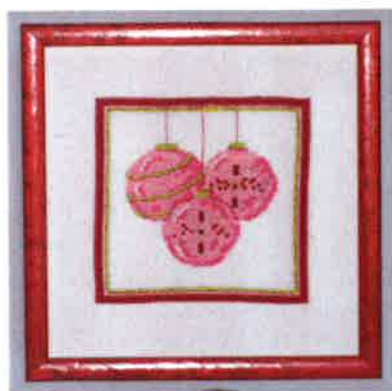
70210 (M) 70211 (H) ca. 19 x 19 cm