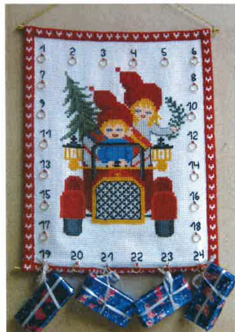
30221 (A) ca. 40 x 50 cm