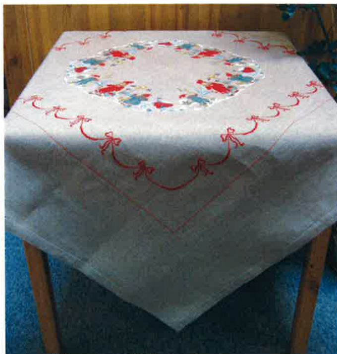
40315 (N) ca. 135 x 135 cm