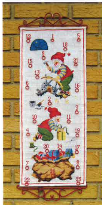
50205 (F) ca. 28 x 64 cm