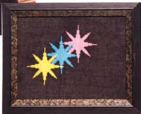
51502 (N) 51503 (D) ca. 20 x 26 cm