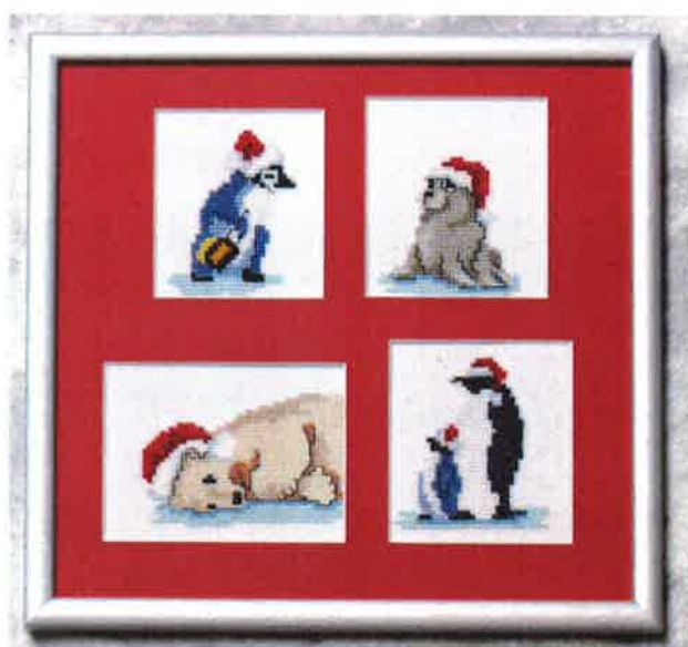
81208 (N) 81209 (D) ca. 30 x 30 cm