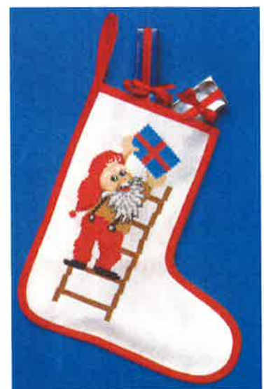
51500 (F) ca. 28 x 48 cm