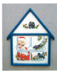
50202 (H) ca. 11 x 16 cm