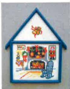
50200 (H) ca. 11 x 16 cm