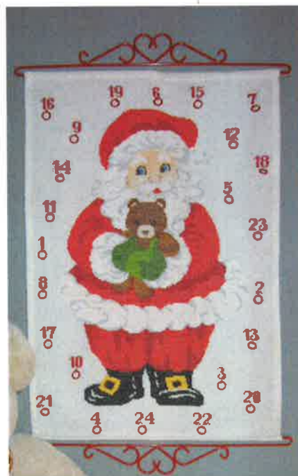
60203 (F) ca. 43 x 60 cm