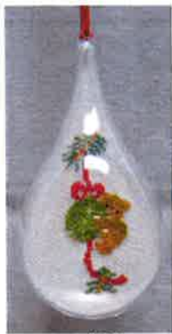
60207 (H) ca. 8 x 18 cm