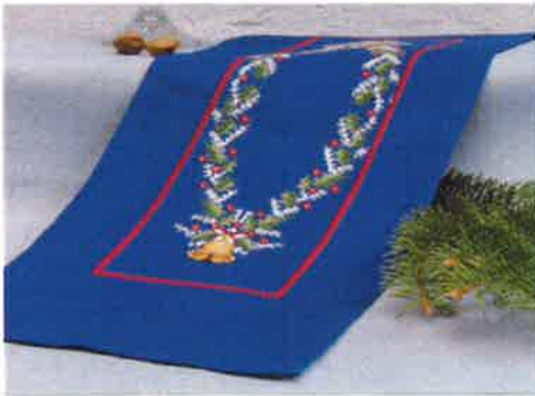
30213 (F) ca. 24 x 70 cm