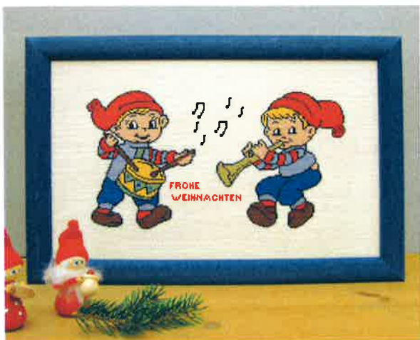
50211 (N) 50212 (D) ca. 28 x 45 cm