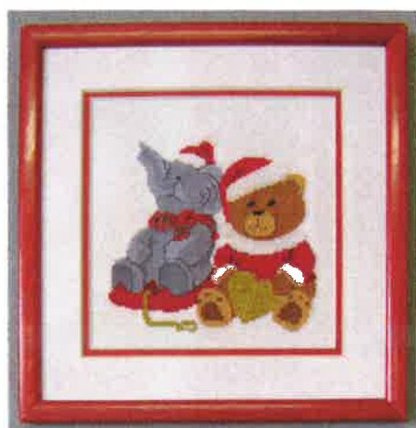
91200 (M) 91201 (E) ca. 21 x 21 cm