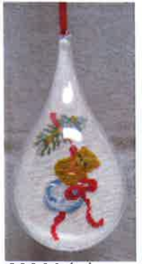
60209 (H) ca. 8 x 18 cm