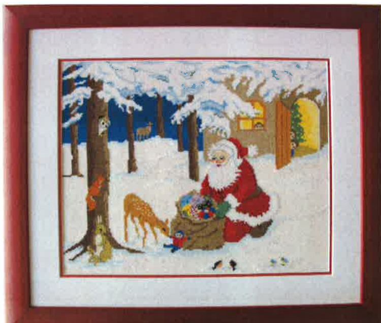
51516 (N) 51517 (D) ca. 38 x 44 cm