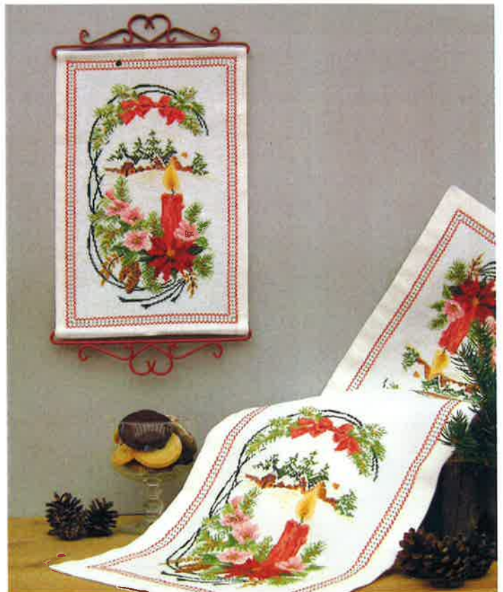
50225 (D) ca. 25 x 39 cm