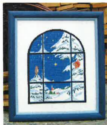
50209 (M) 50210 (H) ca. 30 x 35 cm