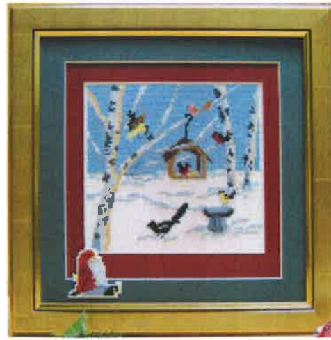
40313 (D) ca. 25 x 25 cm