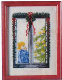
58202 (H) ca. 11 x 15 cm