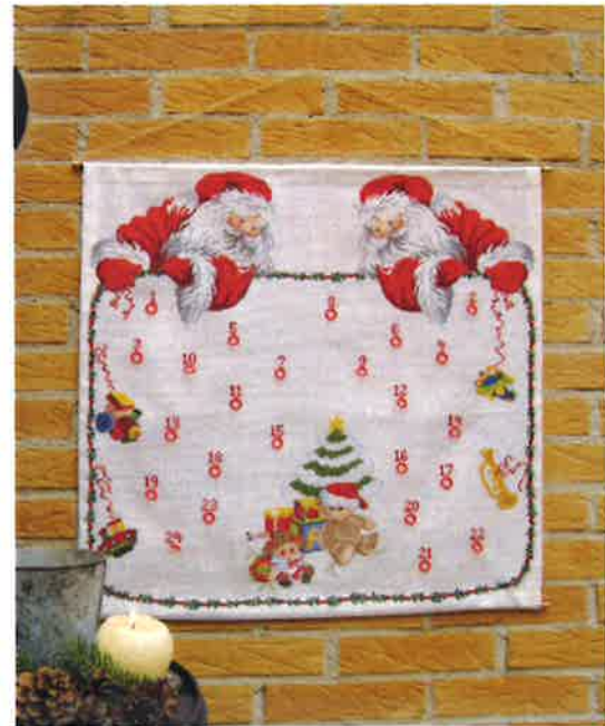
50221 (F) ca. 63 x 65 cm