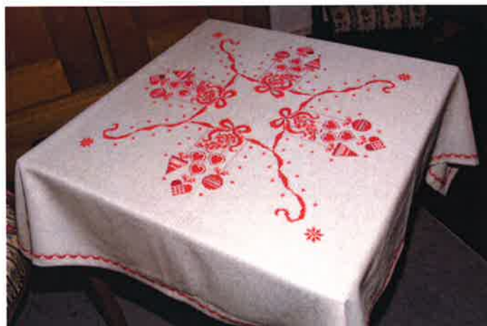
51506 (AB) ca. 130 x 130 cm