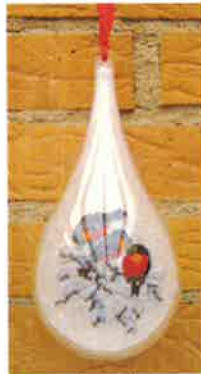
50213 (H) ca. 8 x 18 cm