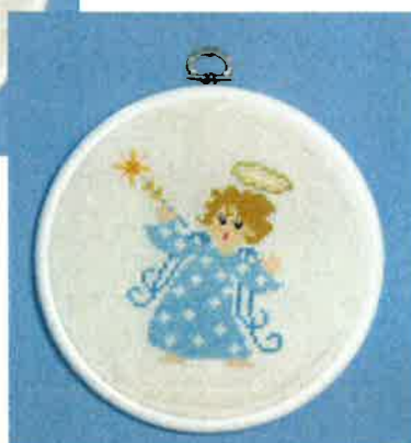
70202 (N) ca. 16Ø cm