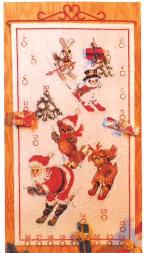
51511 (F) ca. 35 x 60 cm