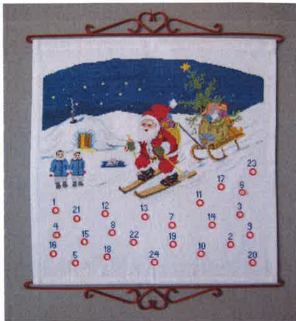
10300 (F) ca. 56 x 55 cm