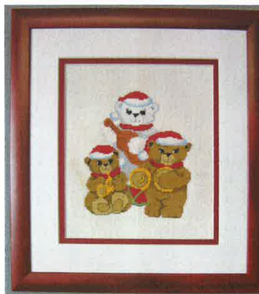
13104 (N) 13105 (D) ca. 34 x 38 cm