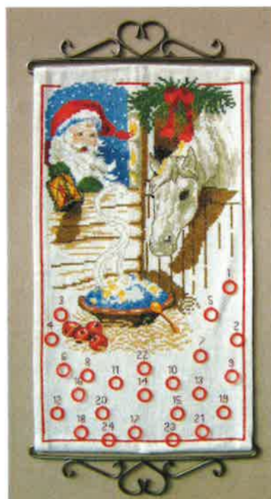
91219 (F) ca. 25 x 45 cm