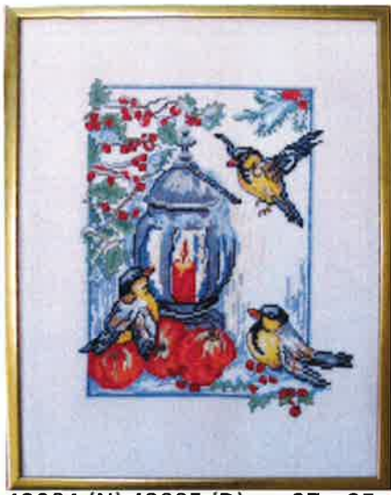
42004 (N) 42005 (D) ca. 27 x 35 cm