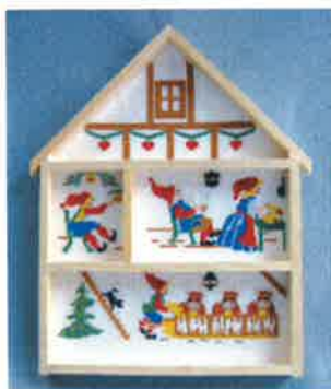
30204 (H) ca. 23 x 31 cm