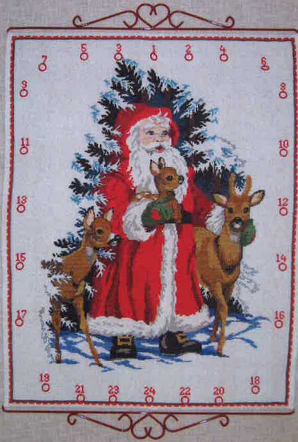
60210 (F) ca. 55 x 72 cm