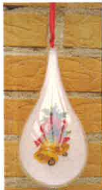
50214 (H) ca. 8 x 18 cm