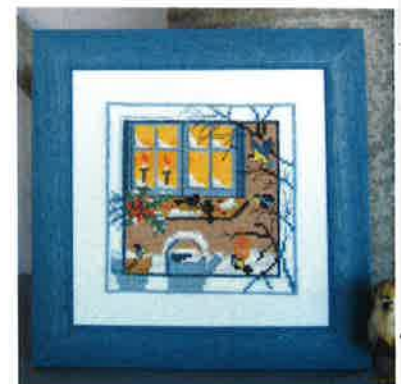
60217 (D) ca. 17 x 17 cm