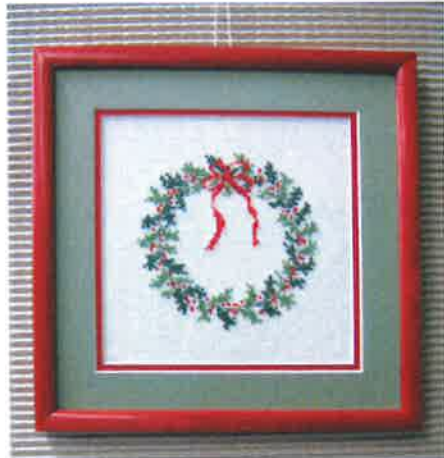
60218 (M) ca. 15 x 15 cm