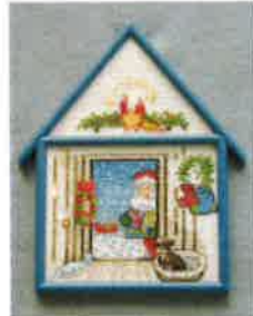
30200 (H) ca. 11 x 16 cm