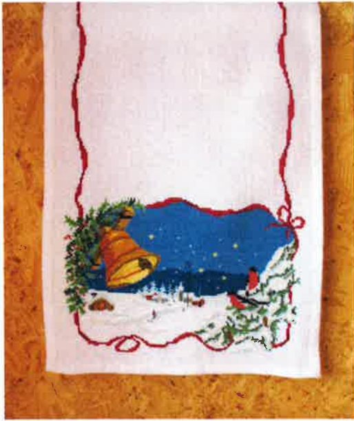
23001 (D) ca. 34 x 88 cm