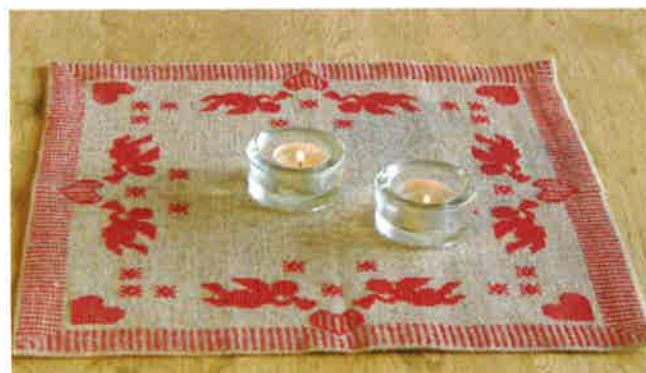
42012 (P) ca. 42 x 42 cm