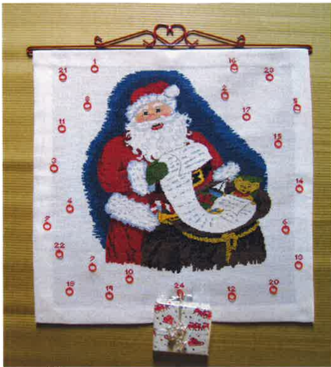
81205 (F) ca. 57 x 59 cm