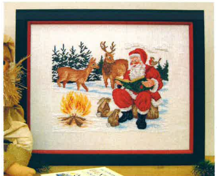
50206 (N) ca. 35 x 41 cm