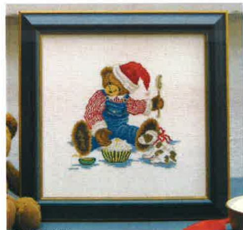
30210 (H) ca. 27 x 27 cm