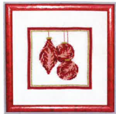
70208 (M) 70209 (H) ca. 19 x 19 cm