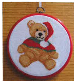
60212 (H) ca. 15Ø cm