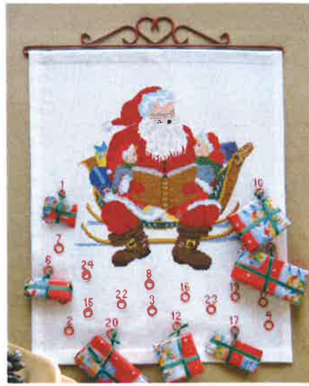
30214 (D) ca. 42 x 52 cm