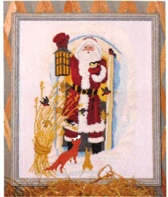
91209 (S) ca. 36 x 47 cm