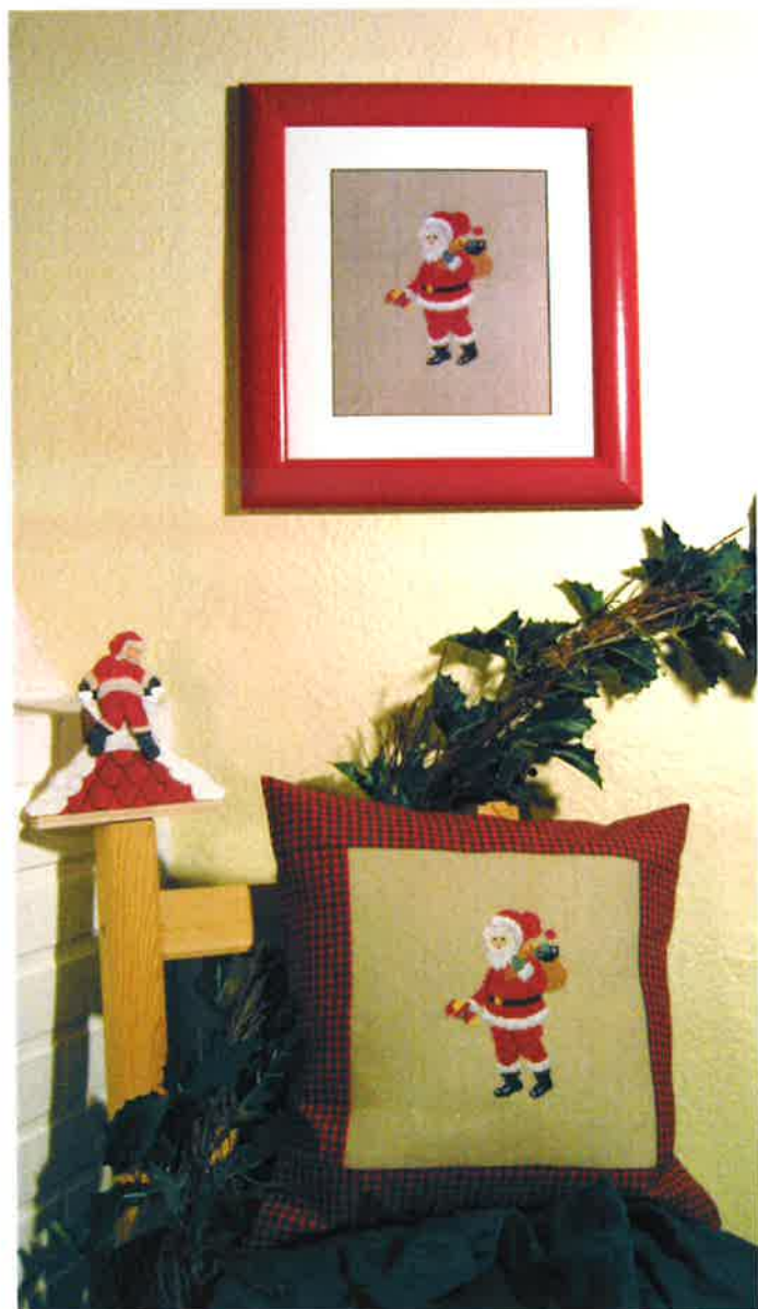
38-2 (N) ca. 40 x 40 cm