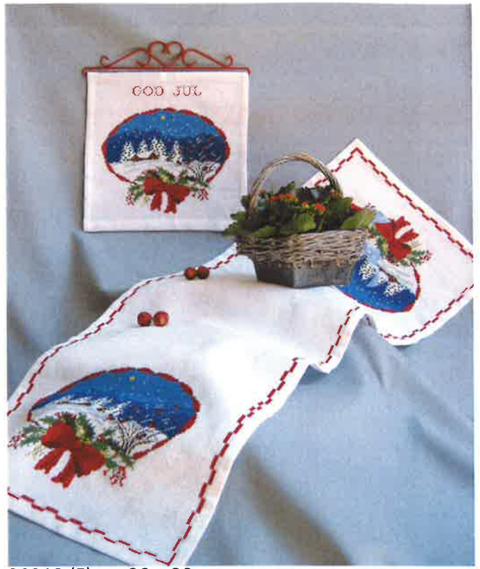
30212 (F) ca. 30 x 30 cm