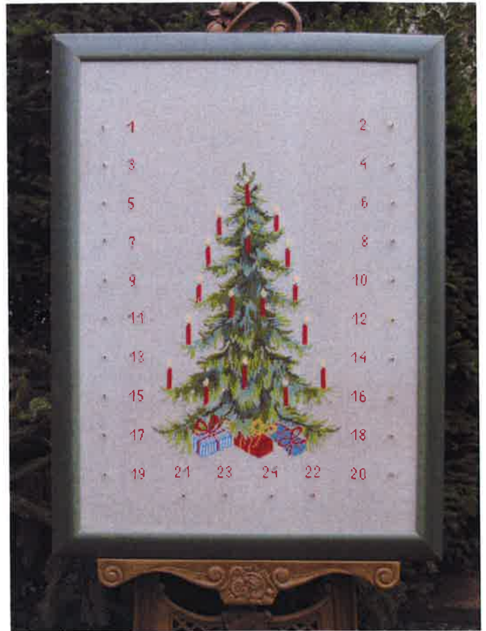
38-7 (AB) ca. 75 x 100 cm