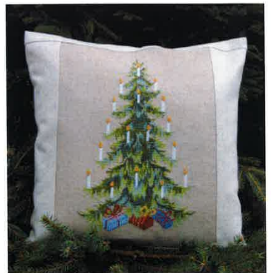
38-8 ca. 40 x 55 cm