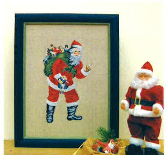
50226 (M) ca. 40 x 50 cm