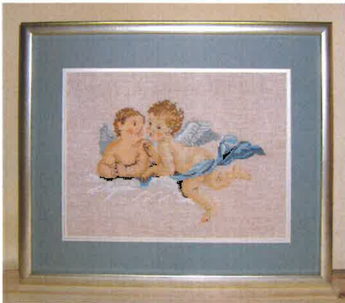
60213 (N) ca. 34 x 39 cm