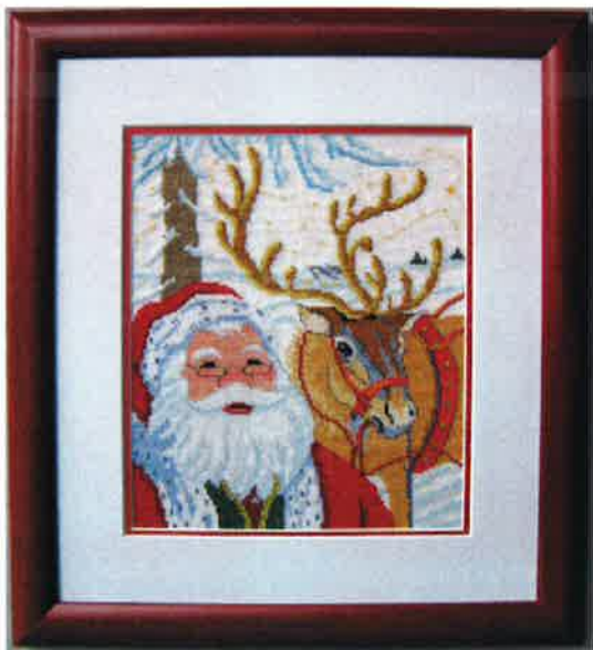
91202 (N) 91203 (D) ca. 22 x 25 cm