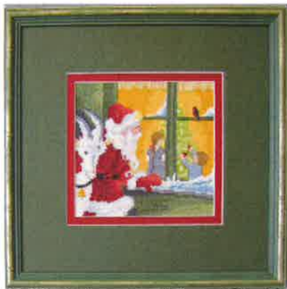
91207 (N) 91208 (D) ca. 30 x 30 cm