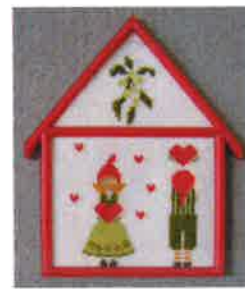
91212 (H) ca. 11 x 16 cm