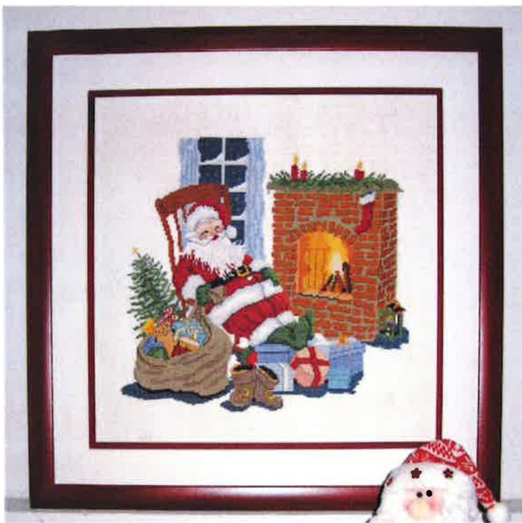
13100 (N) 13101 (D) ca. 54 x 54 cm