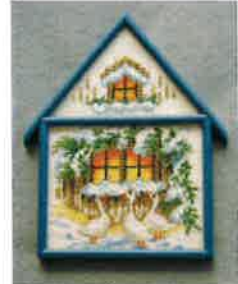
30201 (H) ca. 11 x 16 cm