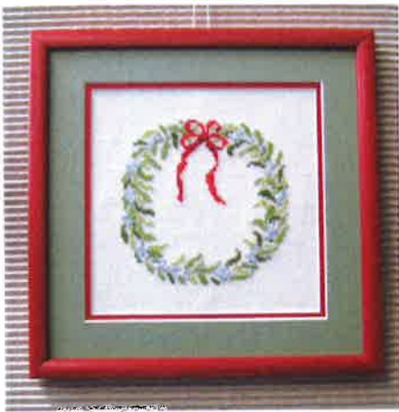
60219 (M) ca. 15 x 15 cm