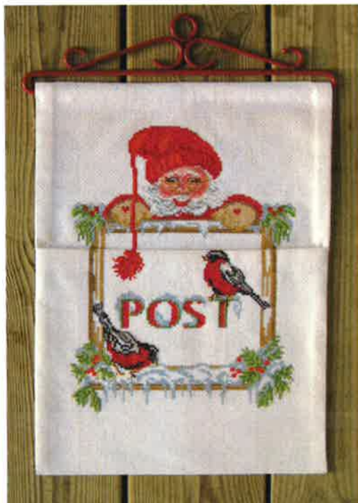
42003 (D) ca. 25 x 34 cm