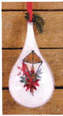
40305 (H) ca. 8 x 18 cm