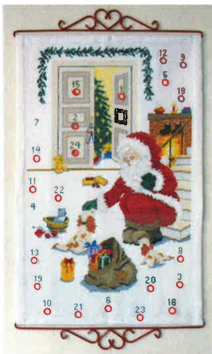
11201 (F) ca. 45 x 67 cm