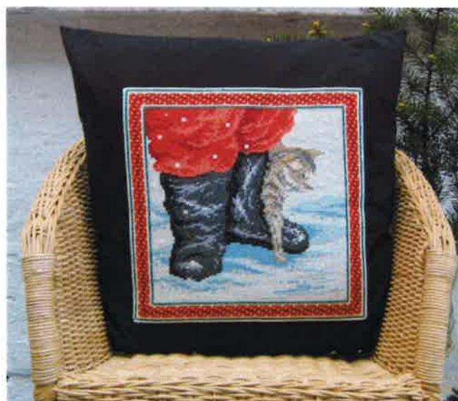
30206 (F) ca. 43 x 43 cm