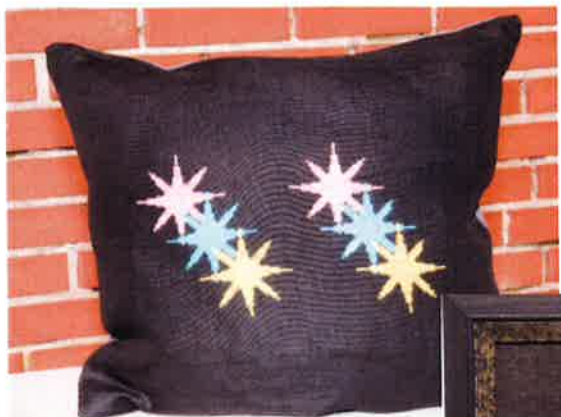
51504 (N) 51505 (D) ca. 35 x 45 cm