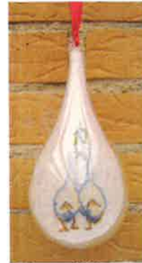
50216 (H) ca. 8 x 18 cm