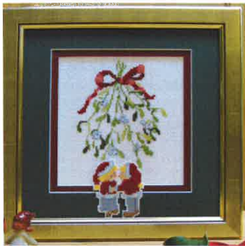
40314 (D) ca. 25 x 25 cm