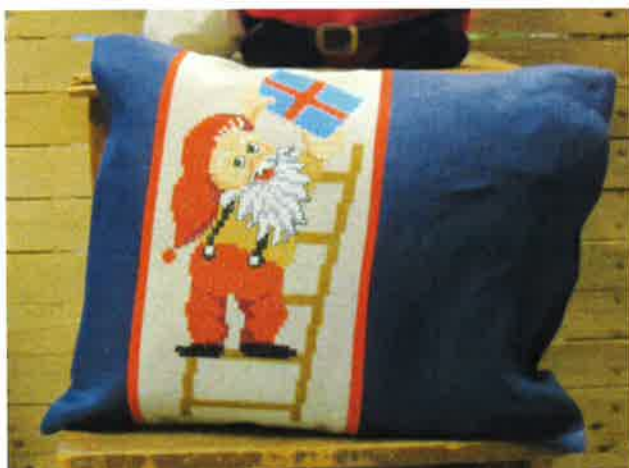
51501(AB) ca. 16 x 35 cm