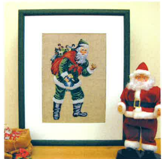
50222 (M) ca. 40 x 50 cm