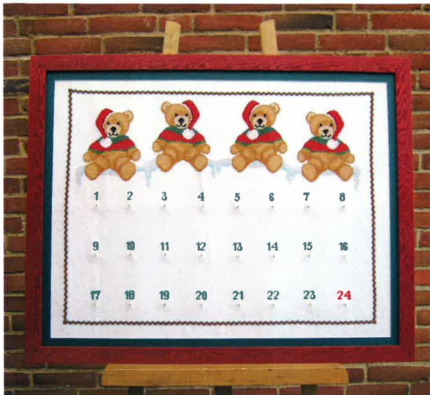
60202(F) ca. 59 x 80 cm