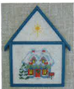
60206 (H) ca. 11 x 16 cm