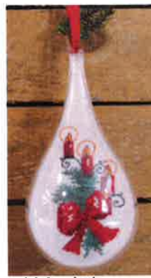
40307 (H) ca. 8 x 18 cm