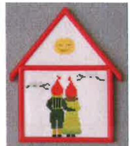
91211 (H) ca. 11 x 16 cm