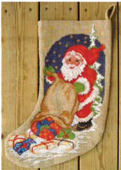
42010 (P) ca. 20 x 30 cm