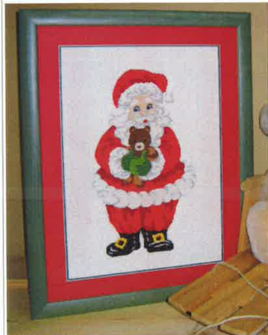
60204 (N) ca. 43 x 60 cm