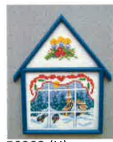
50203 (H) ca. 11 x 16 cm