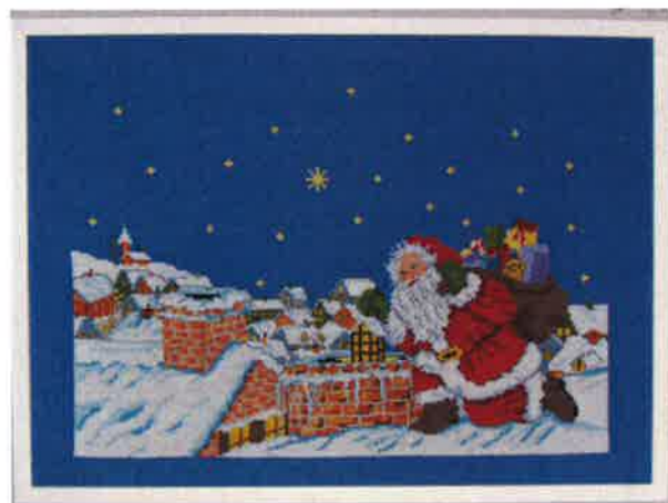
70203 (F) ca. 39 x 54 cm