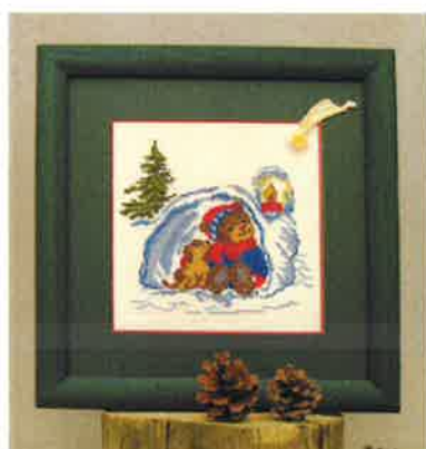
50223 (H) ca. 24 x 24 cm