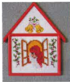
91210 (D) ca. 11 x 16 cm