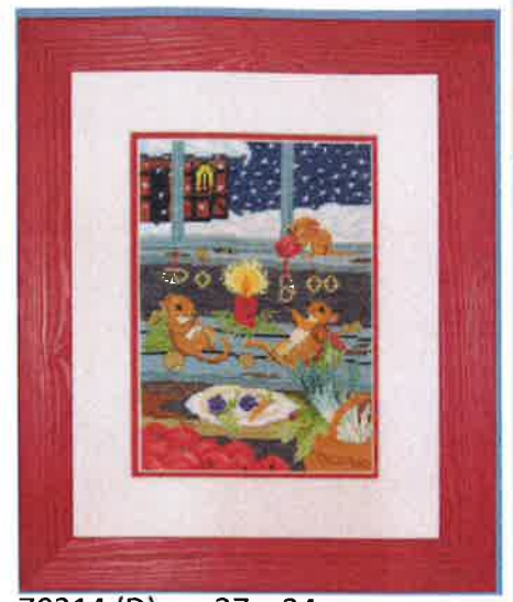
70214 (D) ca. 27 x 34 cm