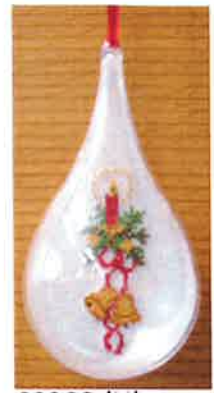
60209 (H) ca. 8 x 18 cm