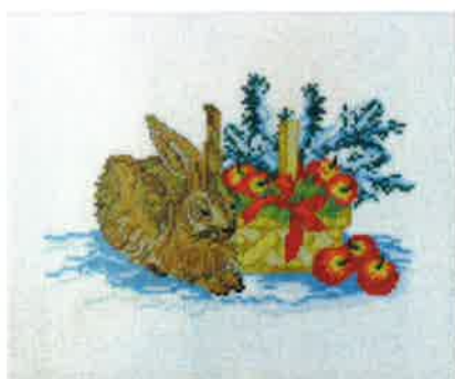
42006 (N) 42007 (D) ca. 24 x 30 cm