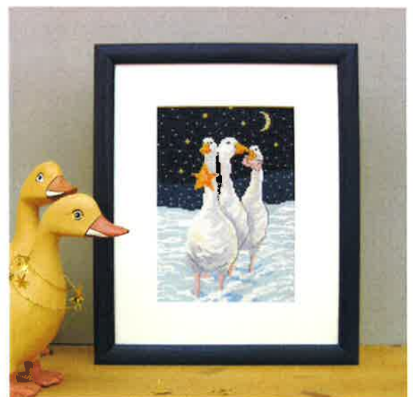
50217 (N) 50218 (D) ca. 28 x 35 cm