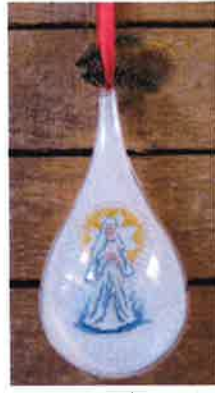
40308 (H) ca. 8 x 18 cm