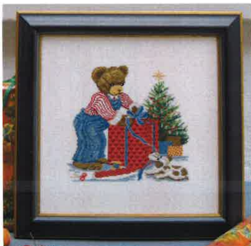
30208 (H) ca. 27 x 27 cm