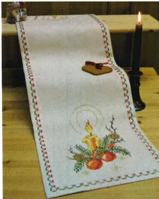
40311 (R) ca. 29 x 102 cm